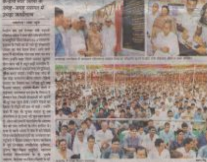
शेखावाटी के नाम को रोशन करने के लिए ओला ने एक बैठक में भाग लिया।